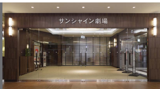
サンシャイン劇場入口