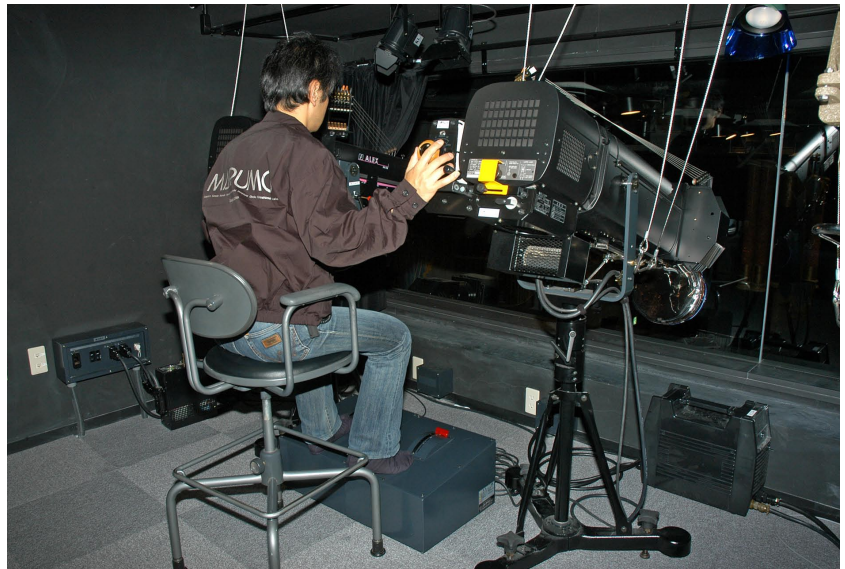
センターピンスポットライト 2台のソフトピンスポットライトの操作

L = 14.4m ..... 1列 C型20A 63個 21回路 C型30A 9個 3回路 C型20A 4個 直2回路