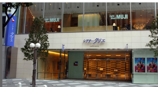
シアタークリエ外観