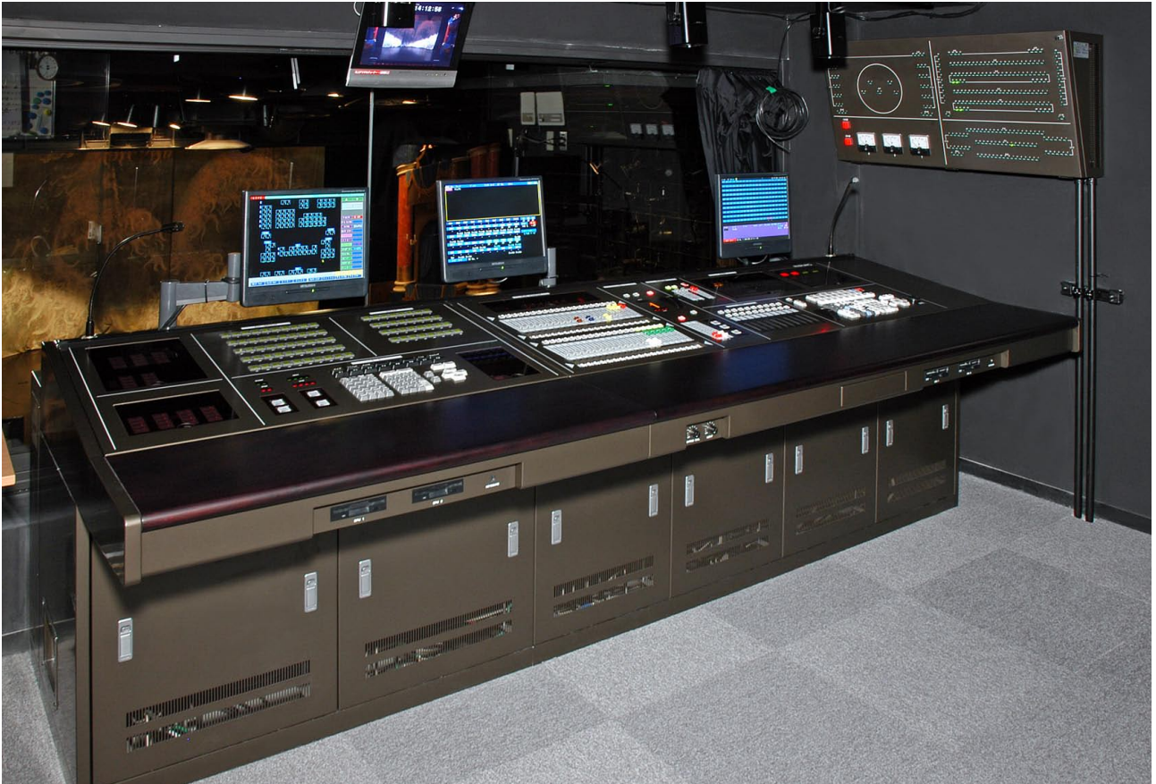
調光室 調光操作卓