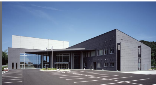
東市来文化交流センター外観