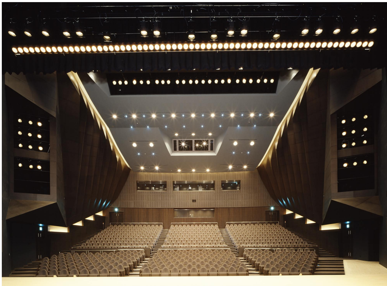
ホール 舞台から観客席を見る