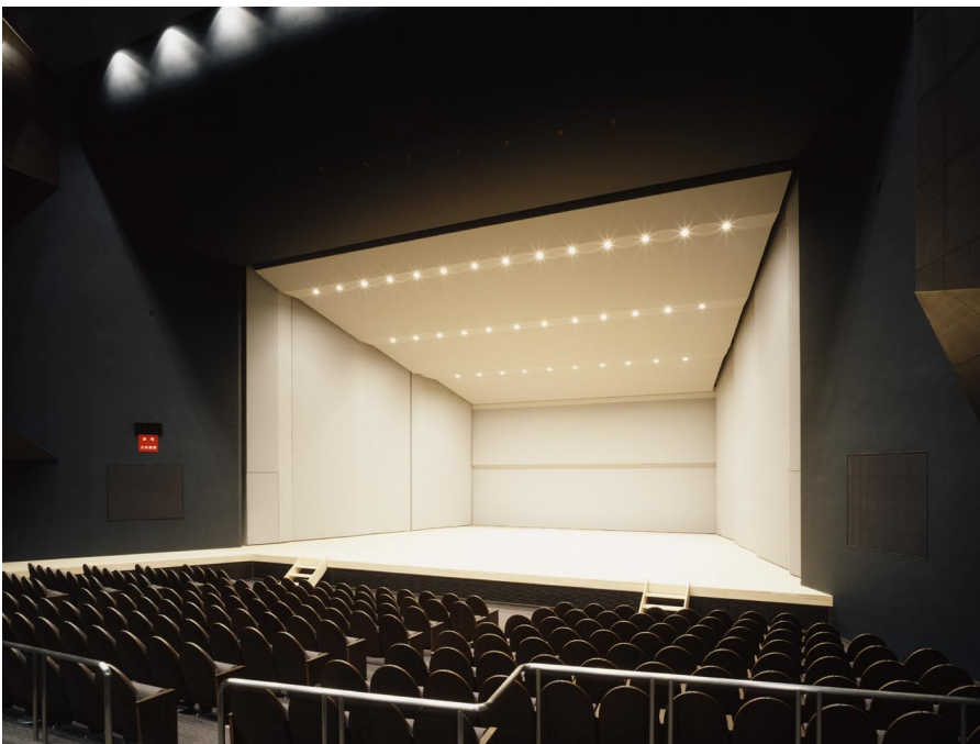
ホール 音響反射板を設置した舞台