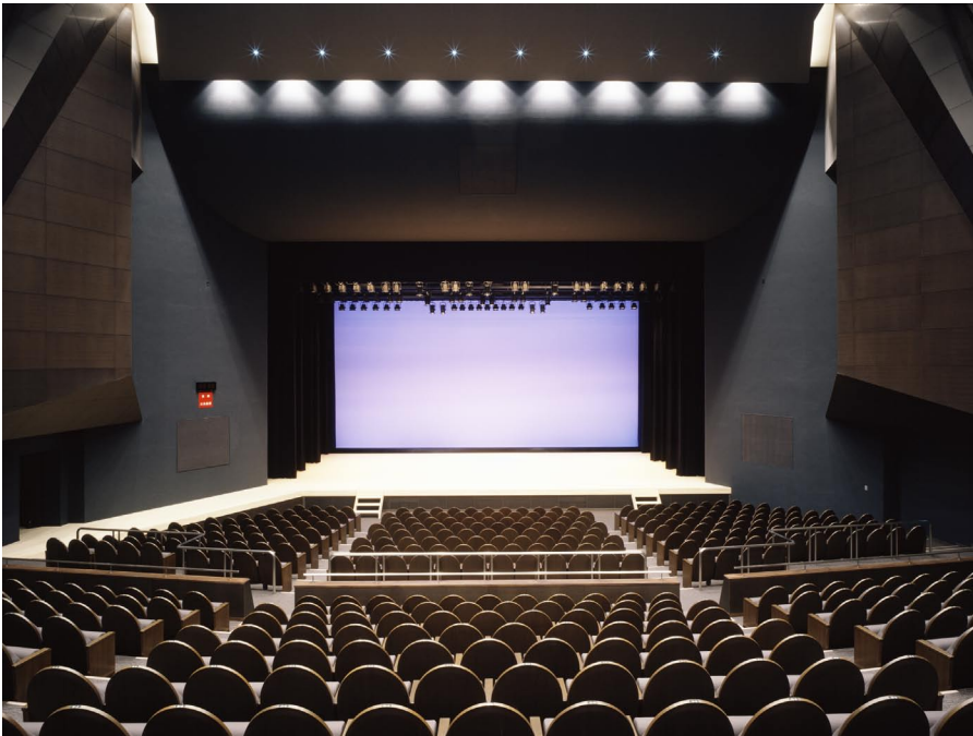
ホール 客席から舞台を見る

LNC 2型 400-1500W ..... 24台 ⑤センタースポットライト クセノンピンスポットライト 2000W ..... 2台 効果器 EPD 2型 1000W ..... 1台 VSD 2型 ..... 1台 SDD 3-4型 ..... 1台 SDD 3-6型 ..... 1台 NAE 2型 1000W ..... 2台 移動器具 CSQ型 1000W ..... 12台