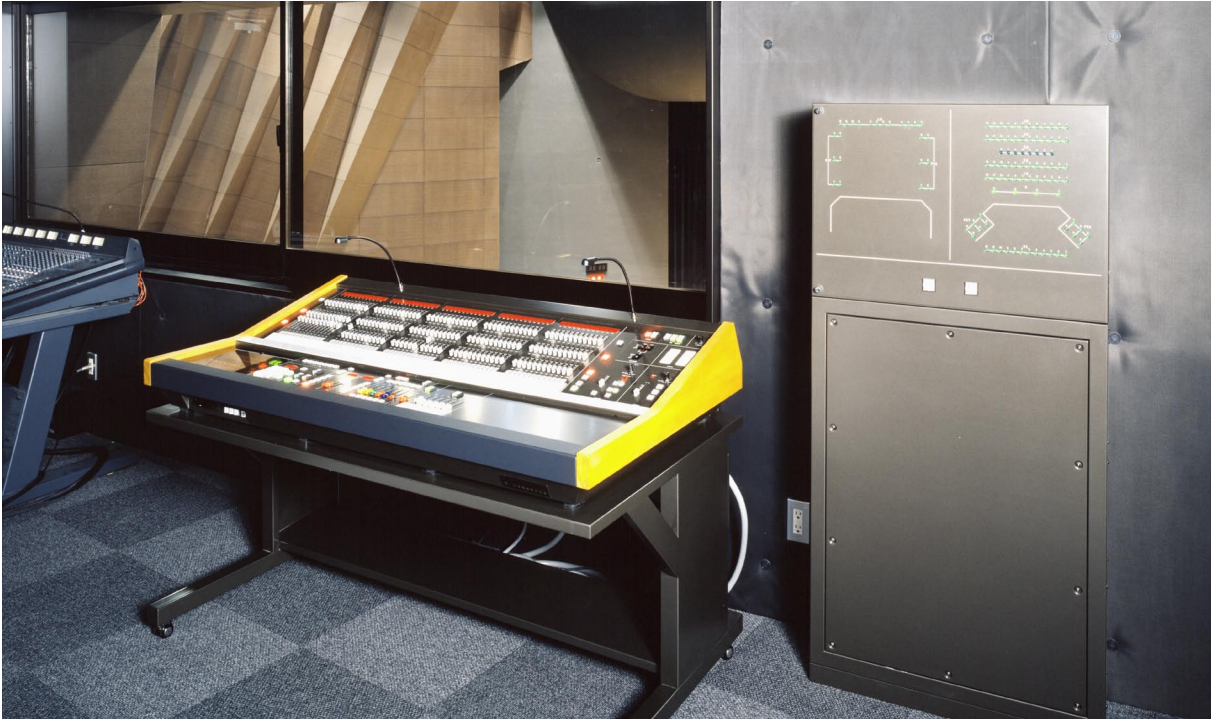
ホール調光室 調光操作卓 (プリティナ型調光操作卓)

舞台照明設備は、ホールの利用内容に合わせた明かりづくりが考慮され、記憶シーン数 250 シーンのメモリ機能と、プリセットフェーダ 60 本×3 段を備えたプリティナ型調光操作卓が導入されました。たとえば、講演会やセレモニーなどでは、事前につくった明かりを記憶させておき、簡単なキー操作によるメモリ再生によって、自在に素速く再現することができ、また、複雑な演出照明が求められる演劇やコンサートでは、プリセットフェーダを使ったマニュアル操作とメモリ機能を活用することによって、多彩な舞台照明デザインをスムーズに実現することができるなど、プリティナ型調光操作卓の機能はこのホールの使いやすさと魅力を最大限にアピールしています。