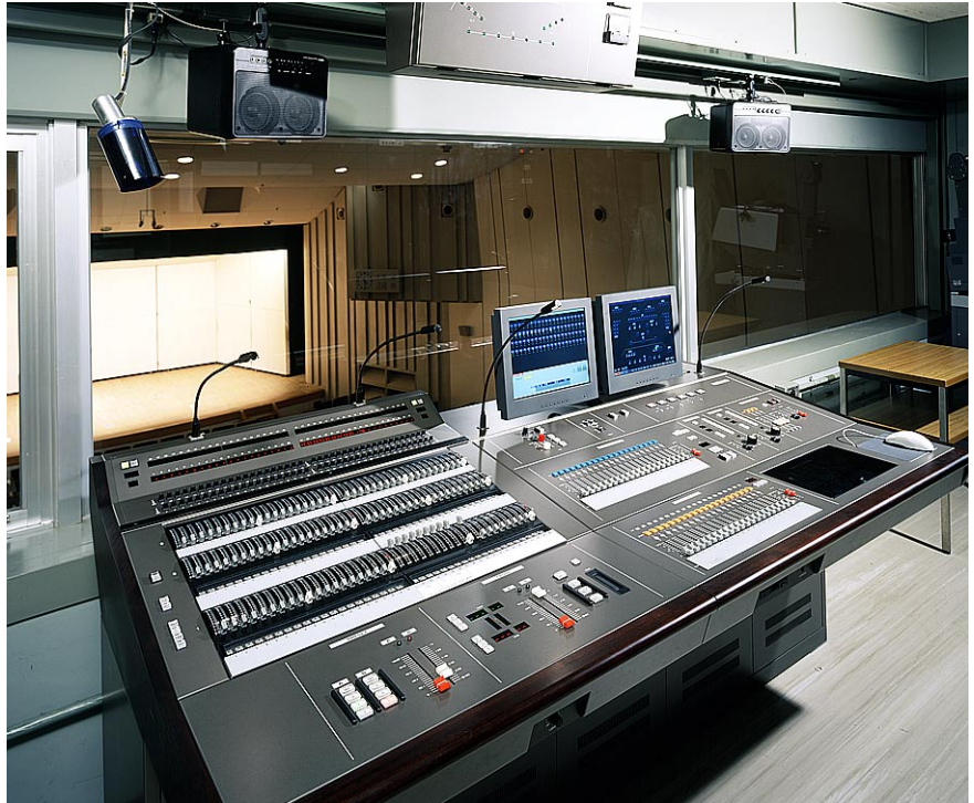
小ホール調光室 調光操作卓

メモリーシーン ..... 2000 シーン グランドマスターフェーダ ..... 1 本 クロスフェーダ ..... 1 組 プリセットフェーダ ..... 40 本× 3 段 マウス式パッチ操作部 (キーボード対応) ..... 1 式 タイムクロスフェーダ ..... 1 組 キューフェーダ ..... 20 本 スタックフェーダ ..... 20 本 プログラムパネル ..... 1 式 15 型 LCD ..... 2 台 3.5 型 FDD ..... 1 台 チェイスパネル ..... 1 式 客席調光スイッチ ..... 1 式 作業灯スイッチ ..... 1 式 負荷モニター盤 LED グラフィック配列 ..... 1 式 舞台袖操作盤 キューマスターフェーダ ..... 1 本 キューフェーダ ..... 10 本 残置フェーダ ..... 1 式 客席調光スイッチ ..... 1 式 作業灯スイッチ ..... 1 式