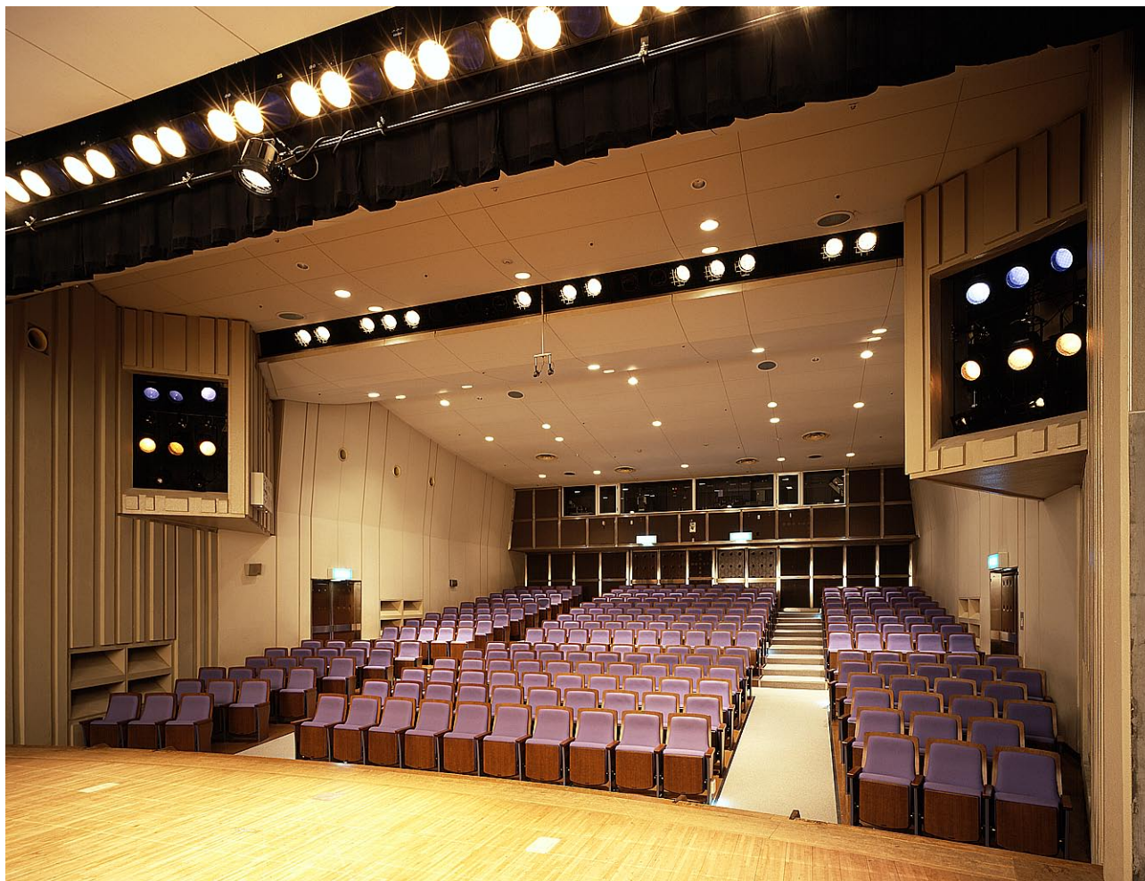
小ホール 舞台から観客席を見る