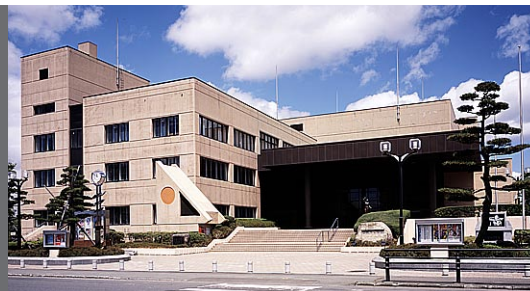
三沢市公会堂外観