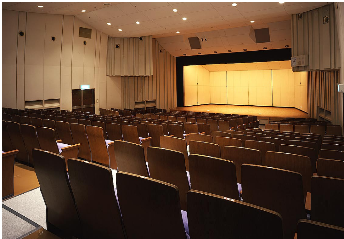
小ホール 観客席から舞台を見る