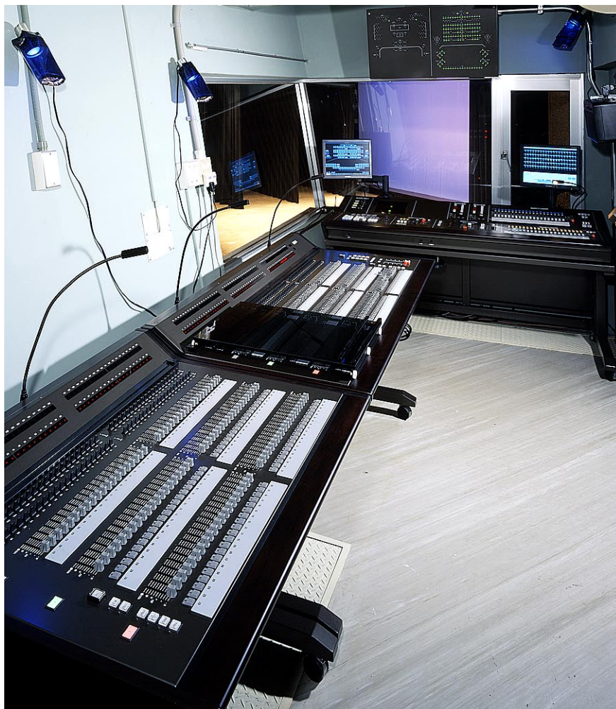
大ホール調光室 調光操作卓とプリセット卓