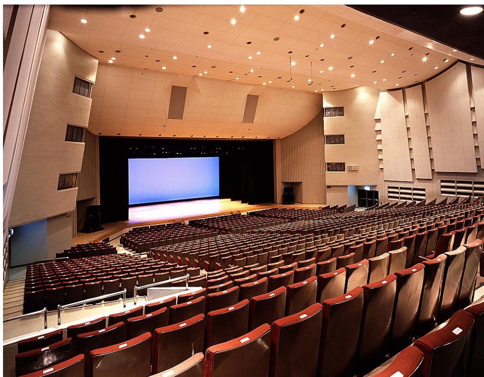
大ホール 観客席から舞台を見る