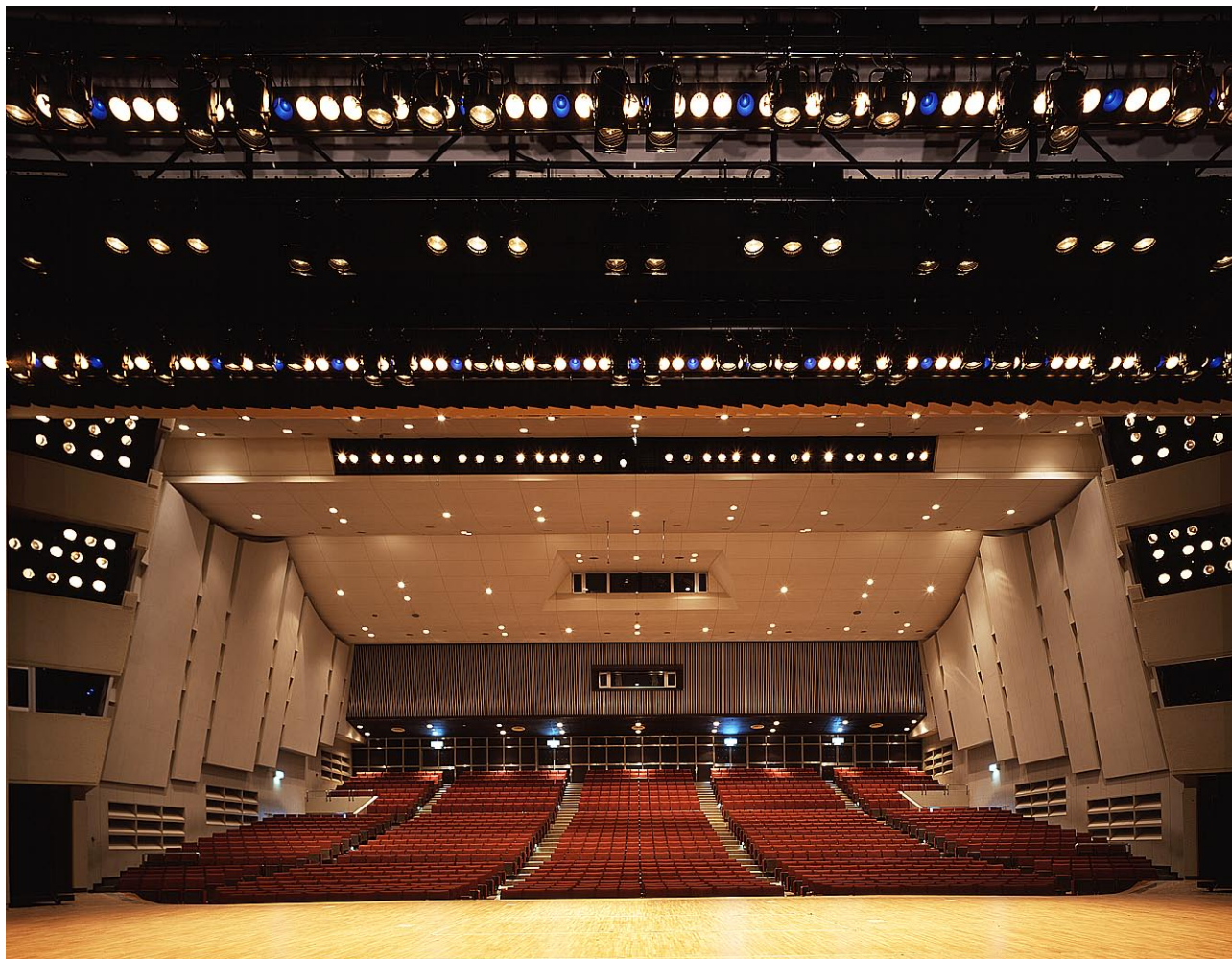
大ホール 舞台から観客席を見る