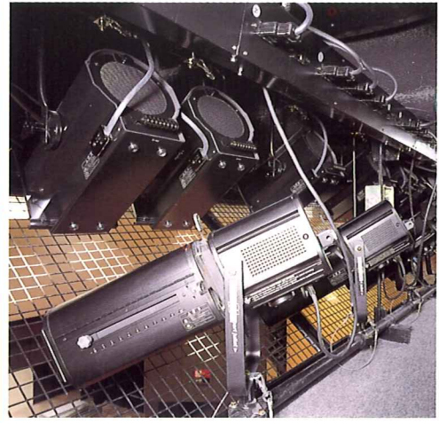
シーリングライト