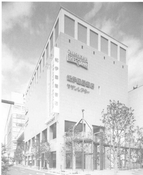
紀伊國屋サザンシアター外観

所在地=東京都渋谷区千駄ヶ谷5-24-2/設計監理=株式会社日本設計 設置主体=株式会社紀伊國屋書店/竣工年月=1996年10月