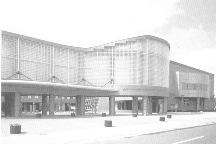
文化センター全景

所在地=三重県三重郡川越町豊田一色314/設計監理=株式会社 岡設計 設置主体=三重県川越町/竣工年月=1996年3月