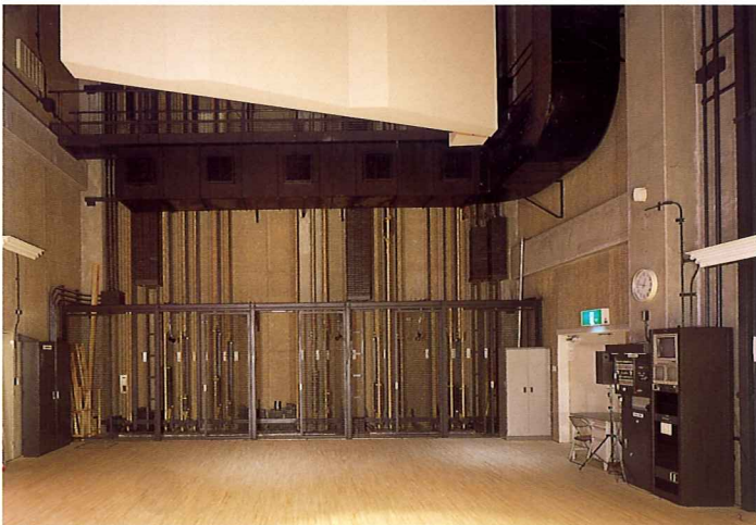
舞台袖の吊物装置