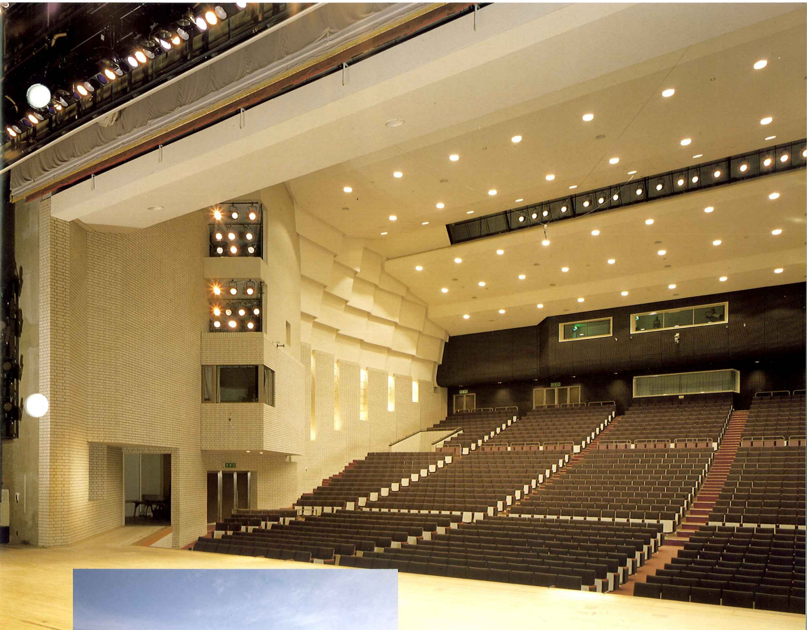
大ホール舞台と観客席

群馬県伊勢崎市昭和町3918 収容人員=1560名 舞台間口=18.0m 奥行=16.0m 高さ=8.0m 設備容量=3φ4W350kVA