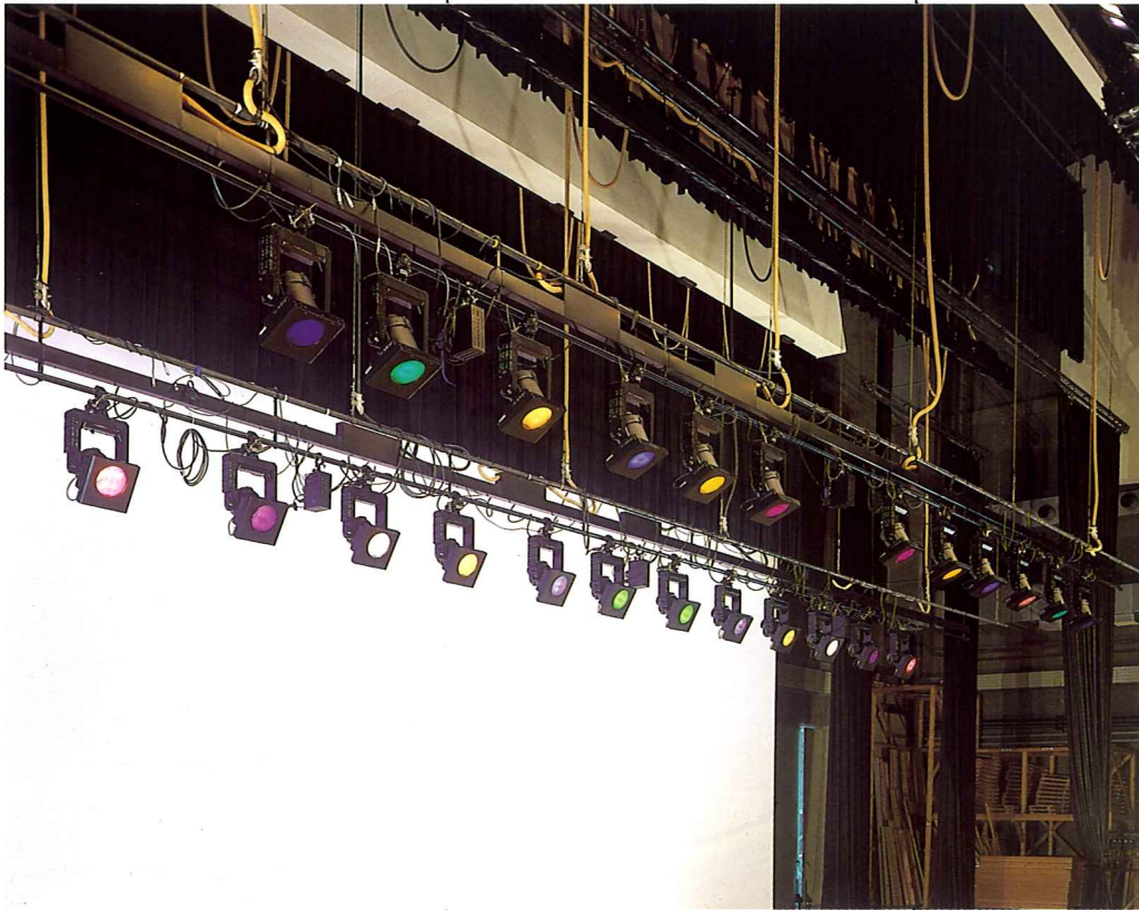
大ホール舞台上部 サスペンションライトに 設備されたムービング スポットライト