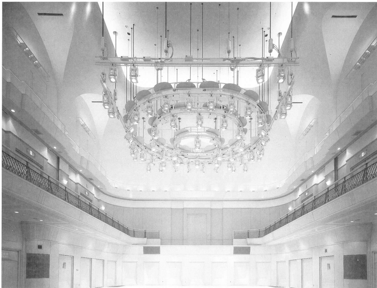
舞台上部円形フライダクト

華やかさ、風格、そして暖かさが醸し出され、くつろいだ中で音楽に親しむ環境が整えられたこのホールに、MARUMOは、静謐な空間を創り出すLOW NOISEタイプのスポットライトをはじめ、照明の仕込作業の省力化をはかるシューティングシステム『サリュース』とムービングスポットライトなど、最新の照明設備で、充実した音楽環境をバックアップしていきます。