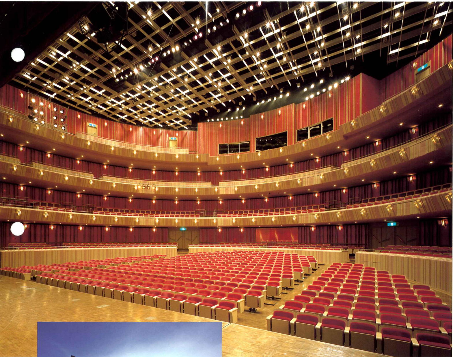
フィルハーモニアホール観客席

大分県別府市山の手町12-1 設計監理＝株式会社磯崎新アトリエ フィルハーモニアホール・収容人員＝1190名 舞台間口＝23.1m 奥行＝10.3m 高さ＝16.0m 設備容量＝3φ4W600kVA