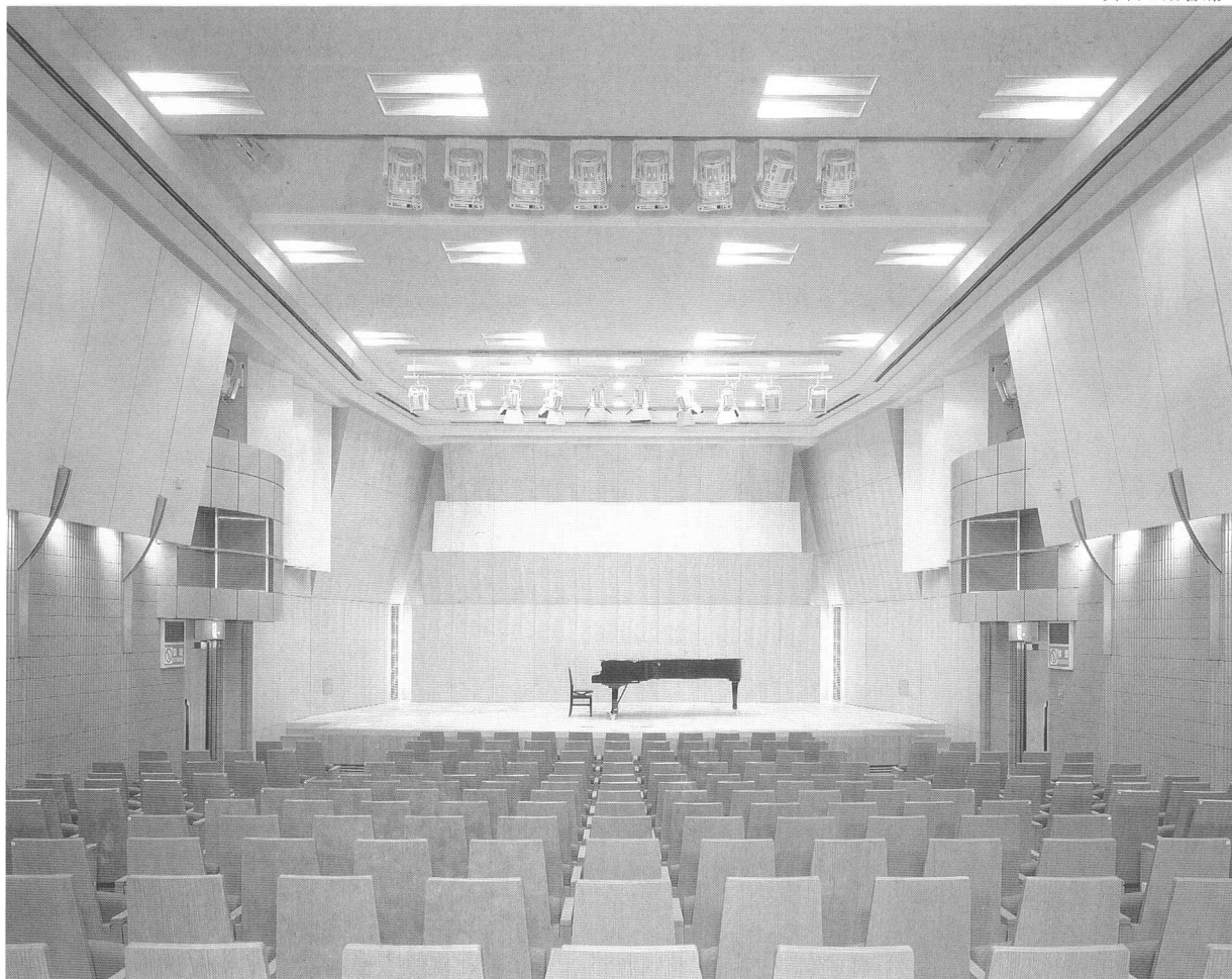
ホール舞台と観客席

その他、サスペンションライトやシーリングライトには昇降装置を設備し、機能性を一層高めるなど、充実した舞台照明設備が区民の意欲的な舞台づくりを力強くバックアップしていくために活躍しています。