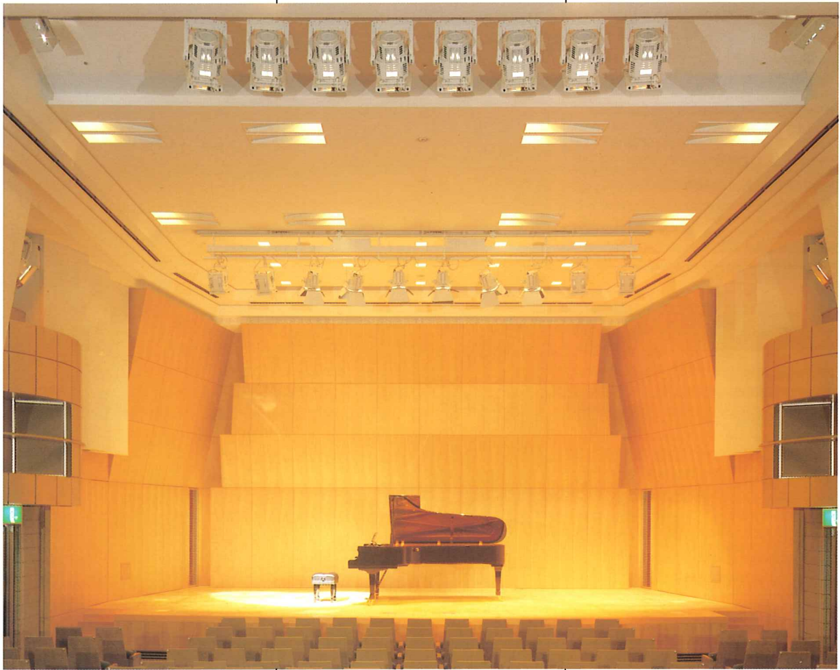
ホール舞台と観客席