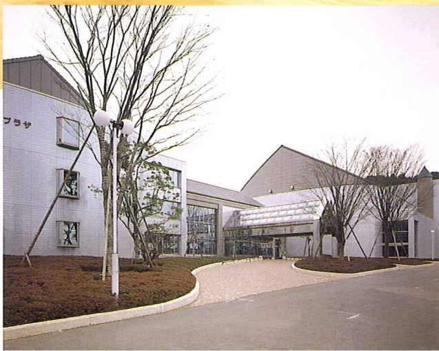
コミュニティセンター外観