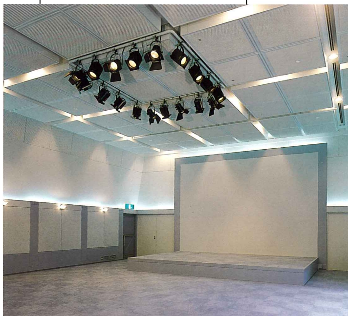
レセプションホール