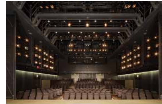
東京芸術劇場シアターウエスト (小ホール2) Tokyo Metropolitan Theatre Theatre West