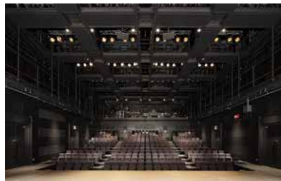
東京芸術劇場シアターイースト (小ホール1) Tokyo Metropolitan Theatre Theatre East