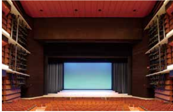
いわき芸術文化交流館 [アリオス] 大ホール Iwaki Performing Arts Center [Alios]