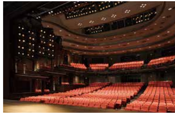
東京芸術劇場プレイハウス (中ホール) Tokyo Metropolitan Theatre Playhouse