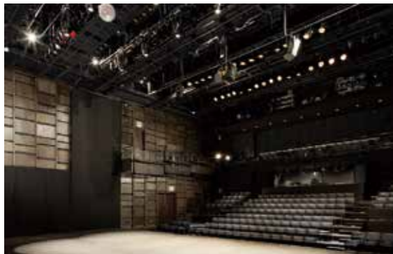
いわき芸術文化交流館 [アリオス] 小劇場 Iwaki Performing Arts Center [Alios]