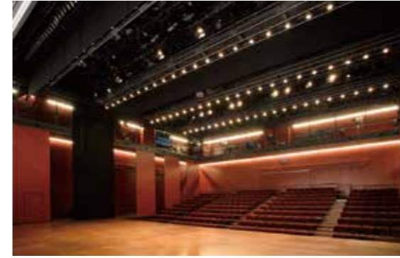
座・高円寺 1 ZA-KOENJI Public Theatre