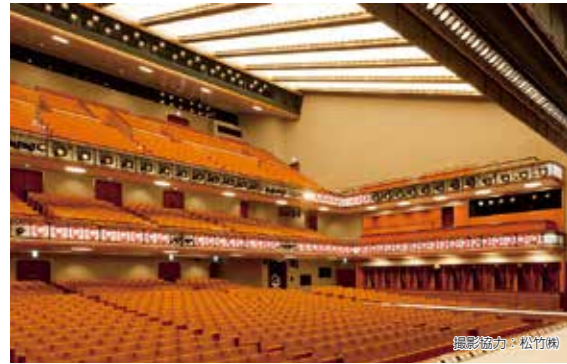
歌舞伎座 Kabukiza Theatre