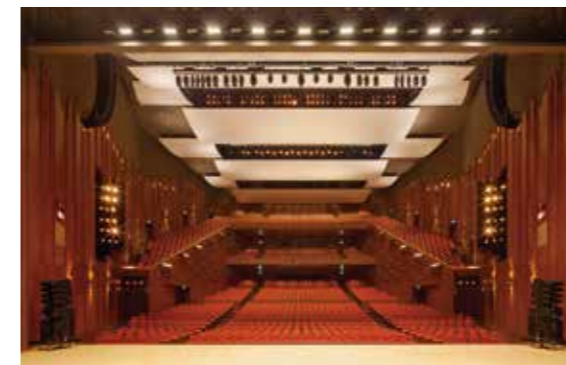
ウェスタ川越 大ホール Westa Kawagoe