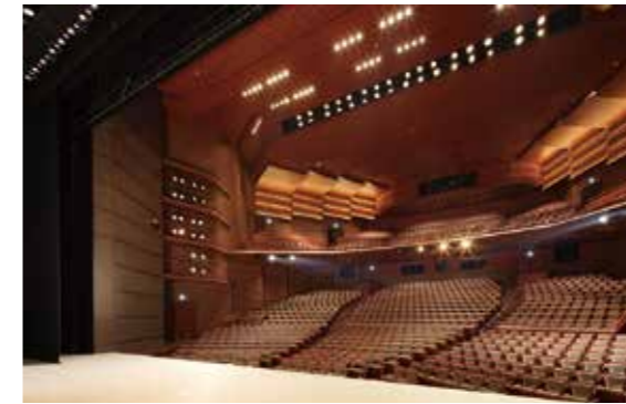
柏崎市文化会館 [アルフォーレ] Kashiwazaki City Performing Arts Center [Artforet]