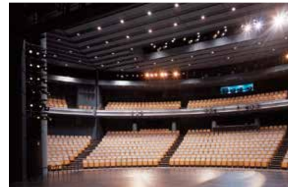
新国立劇場 中劇場 New National Theatre, Tokyo Playhouse