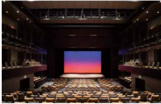
いわき芸術文化交流館 [アリオス] 中劇場 Iwaki Performing Arts Center [Alios]