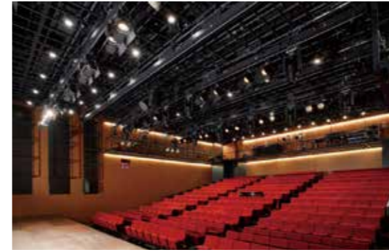
座・高円寺 2 ZA-KOENJI Public Theatre