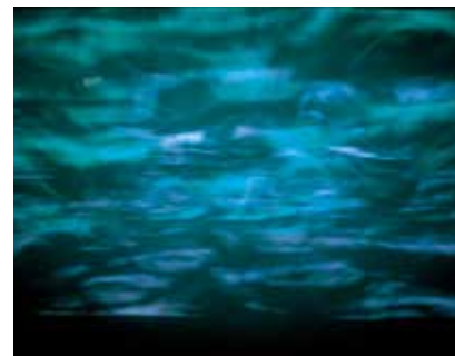
■パターンイメージ (2台使用) Effect image (Use two machines)